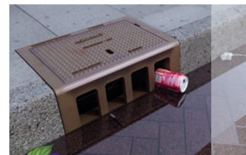
Water op straat