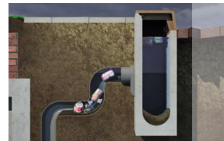
Verstopping van uitlaat door zwerfvuil