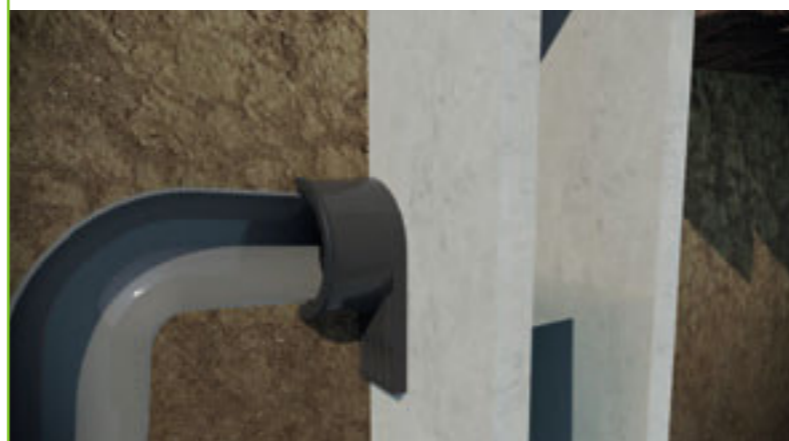
De P-LINE is voorzien van een kunststof uitlaat met flexibele aansluiting