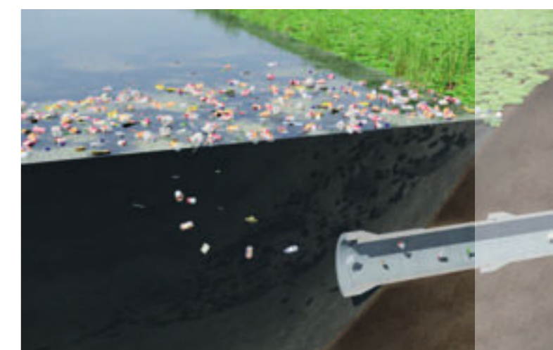
Verontreiniging van oppervlaktewater